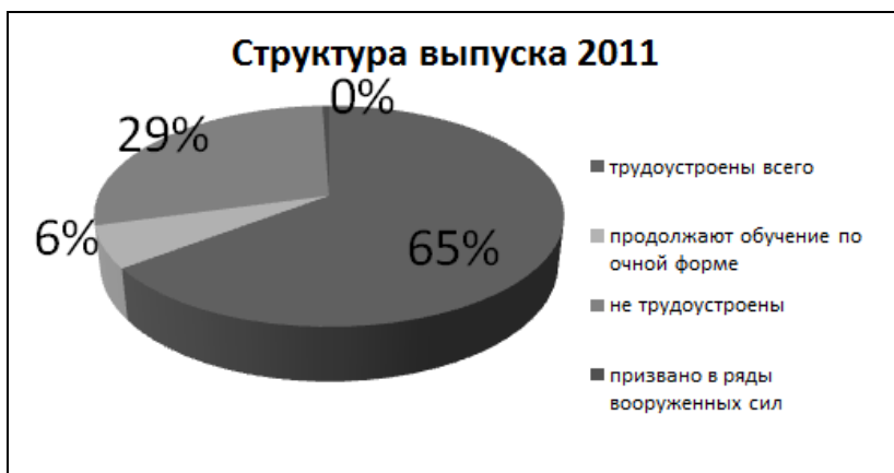
Диаграмма 2. Показатели трудоустройства выпускников техникума в 2011 г.

В целом по выпуску наблюдается рост количества трудоустроенных выпускников на 17%, соответственно, снижение количества нетрудоустроенных – на 13%. Также в 2012 году заметно сократилась доля желающих продолжить обучение в ВУЗах по очной форме обучения (диаграмма 2 и диаграмма 3).