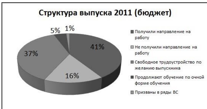
Диаграмма 3. Показатели трудоустройства выпускников в 2011 году

В 2010 году устроились на работу по направлению и самостоятельно – 70 % выпускников от общего числа. В 2011 году – 78 %, что на 8 % выше предыдущего показателя.